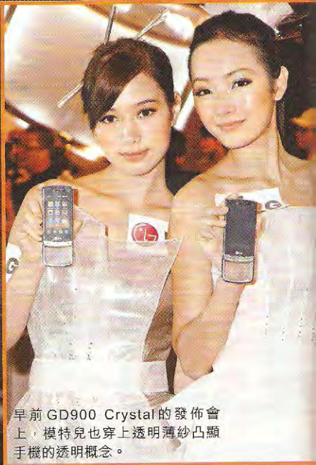
早前 GD900 Crystal 的發佈會上，模特兒也穿上透明薄紗凸顯手機的透明概念。

「透明」意味著看不到，但卻也可理解為「無限視野」。LG GD900 Crystal 便讓手機業界看到不