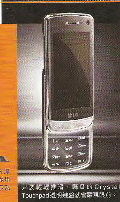
只要輕輕推滑，矚目的 Crystal Touchpad 透明鍵盤就會躍現眼前。