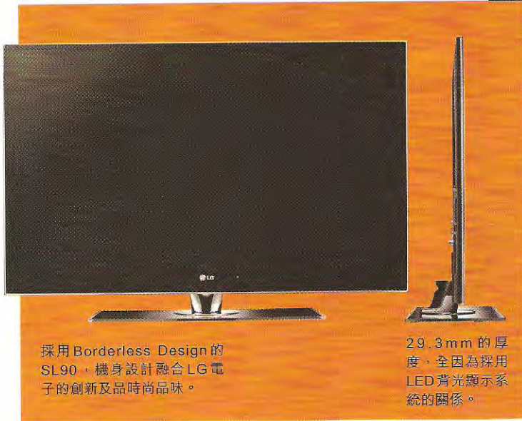
採用 Borderless Design 的 SL90，機身設計融合 LG 電子的創新及品時尚品味。